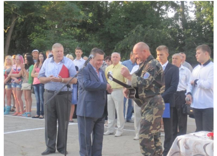
Информационный центр «Экспресс-Инфо»

После торжественной линейки ребята отправятся в свой класс на первый урок. В добрый путь!